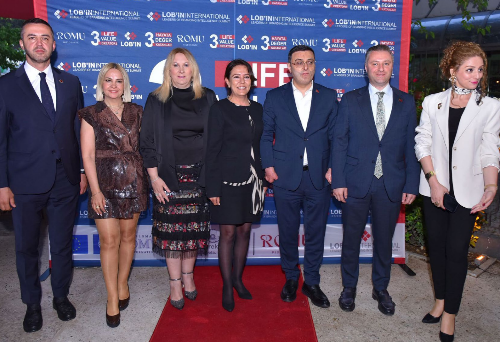
Geceye katılan davetliler kırmızı halda yürürken şıklıkları ile de öne çıktı. Ödül alan isimlerin heyecanı ise dikkatlerden kaçmadı.